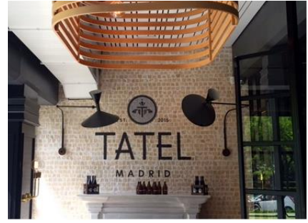
terrazza acristalada es ideal para el verano...