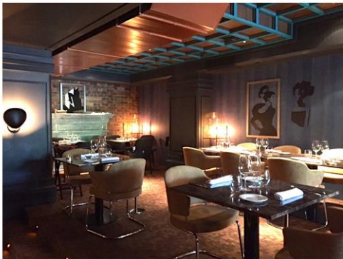
Cada reservado está inspirado en un artista diferente