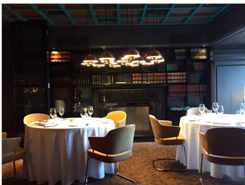
El restaurante se divide en varias zonas