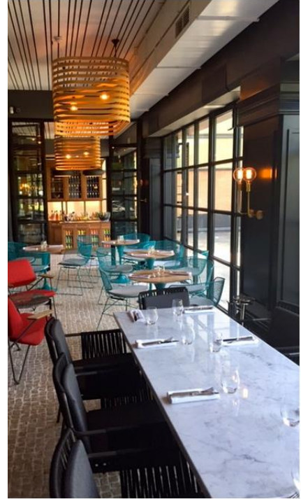
a comida exquisita y el servicio inmejorable