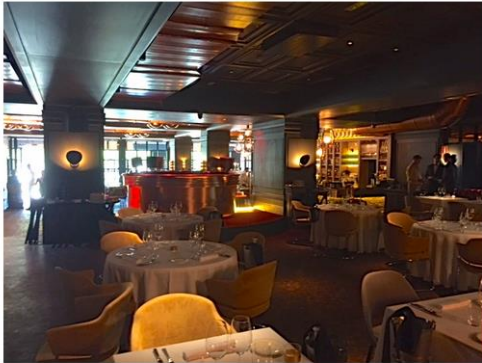
La decoración es muy moderna pero con un toque vintage