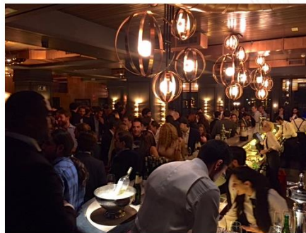
La inauguración fue todo un éxito

¿Os lo vais a perder? ¡¡Nos vemos en Paseo de la Castellana 36 !!