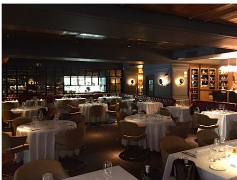
Hay terraza, zona con mesas altas, comedor principal y reservados...