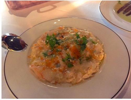
Ensaladilla rusa de cigala