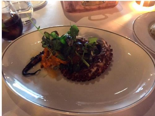
Pulpo a la brasa con papas y mojo