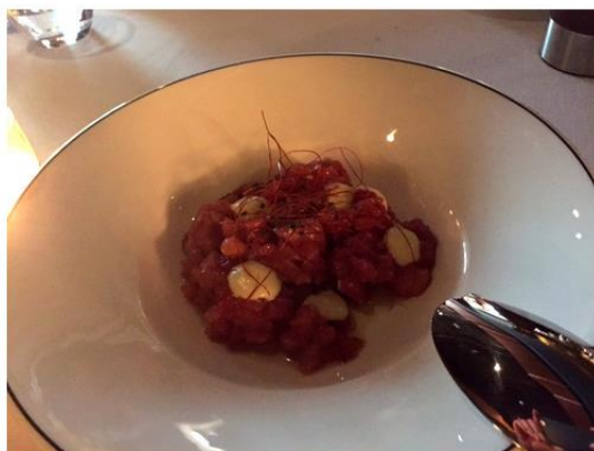
Tartar de atún rojo