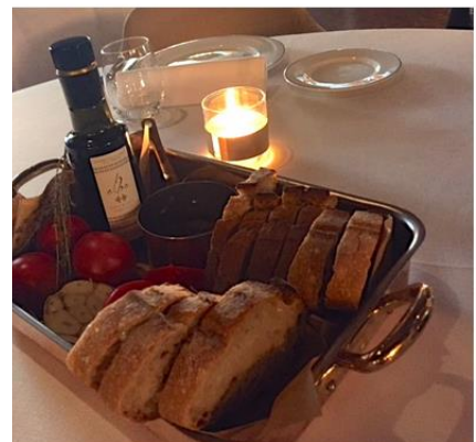
estos fueron uno de los platos que probamos: