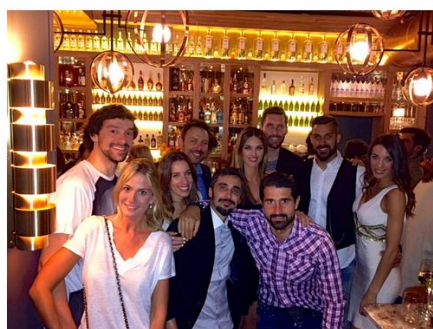
Muchos amigos quisieron acompañarnos